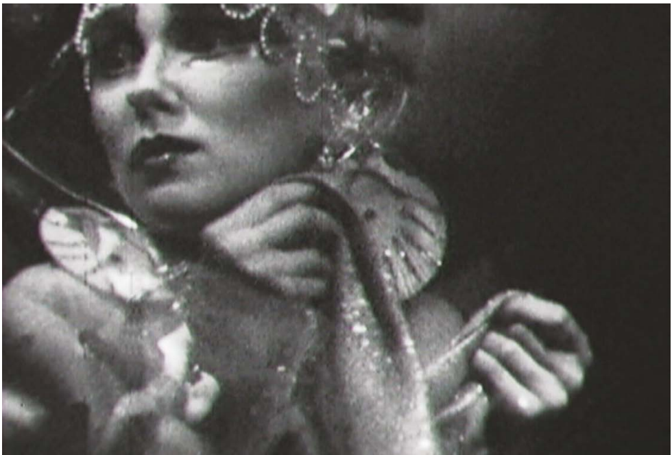
Rollo Seis. El Gran Tarot de Charles Ludlam. 1987

La exposición incluye también una obra muy particular que pocas veces ha sido mostrada: Rollo Seis. El Gran Tarot de Charles Ludlam , 1987, uno de los pocos filmes del Teatro del Ridículo y de su fundador el actor Charles Ludlam. En medio del estallido de la revolución sexual de los años 60, Ludlam alquilaba un cine porno donde él y su grupo actuaban de manera experimental y exuberante. Leandro Katz colaboró con la compañía en diferentes funciones, junto a la película, se muestran en monitores secuencias de imágenes de siete piezas del Teatro del Ridículo: Cuando las reinas se embisten o La conquista del universo , Mojones en el infierno , El Gran Tarot , Barbazul (una adaptación del cuento de H.G. Wells), La isla del Dr. Moreau , Los eunucos de la Ciudad Prohibida , Corn y Camille .