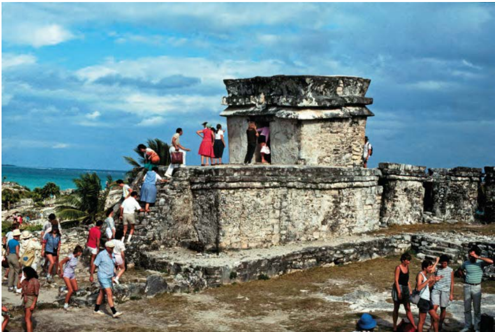
Templo del Dios descendiendo. Tulum, 1985. Proyecto Catherwood, 1985-1993/2001.