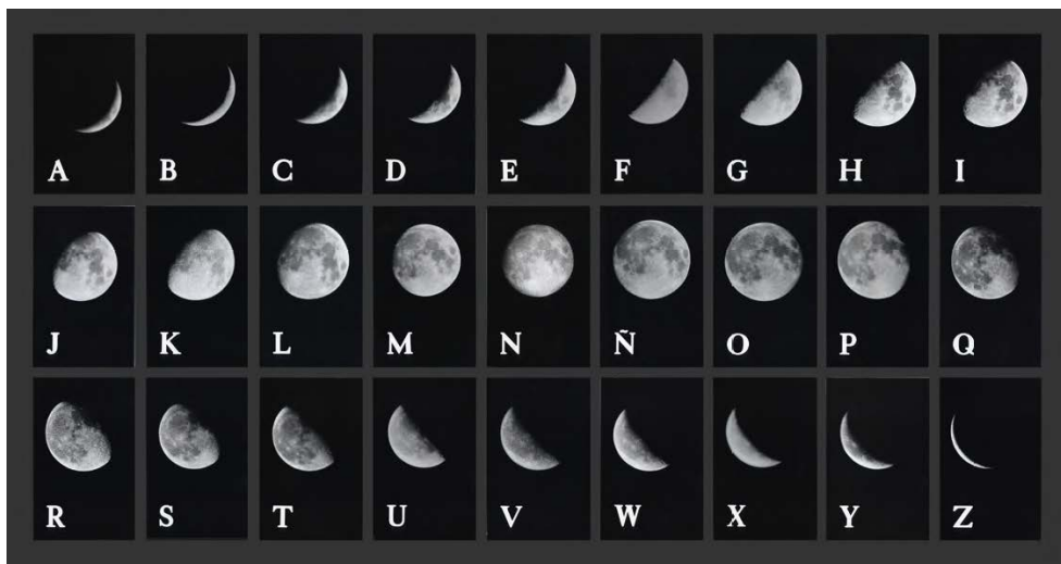
Alfabeto lunar, 1978

lunares. Un proyecto exhaustivo y detallado en el que fotografiaba el ciclo lunar con la intención de conformar un nuevo alfabeto. Si bien el mes lunar es de veinte días, era importante lograr 27 variaciones para completar una serie que incluyera la letra ñ. La meteorología jugaba un papel decisivo en este proyecto, ya que la luna a veces atraviesa el cielo durante el día, y algunas noches la visibilidad no es buena. Si perdía la oportunidad de fotografiar la transición correcta en ese mes lunar, debía esperar el nuevo ciclo, veinte días después.