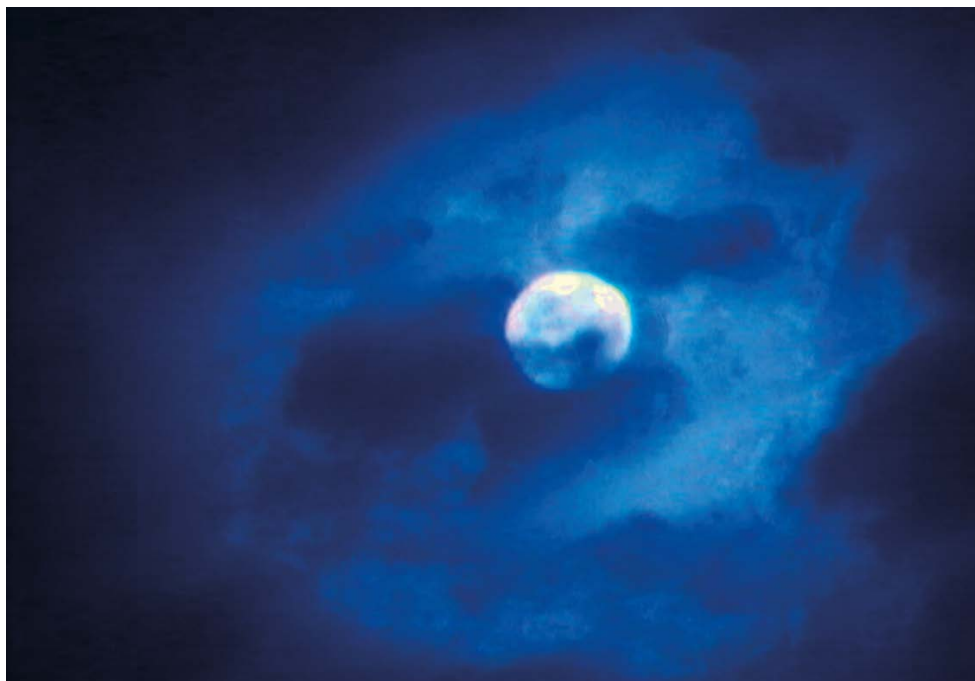
Tomas lunares, 1976

Entre 1976 y 1982, realizó una serie de películas experimentales sobre la luna. En esta muestra se proyectan tres de ellas: Tomas lunares , Notas lunares y La ventana de Judas . El proceso consistía en filmar la salida y puesta de la luna en diferentes lugares: azoteas de Nueva York, playas de Rhode Island y sitios de Yucatán.